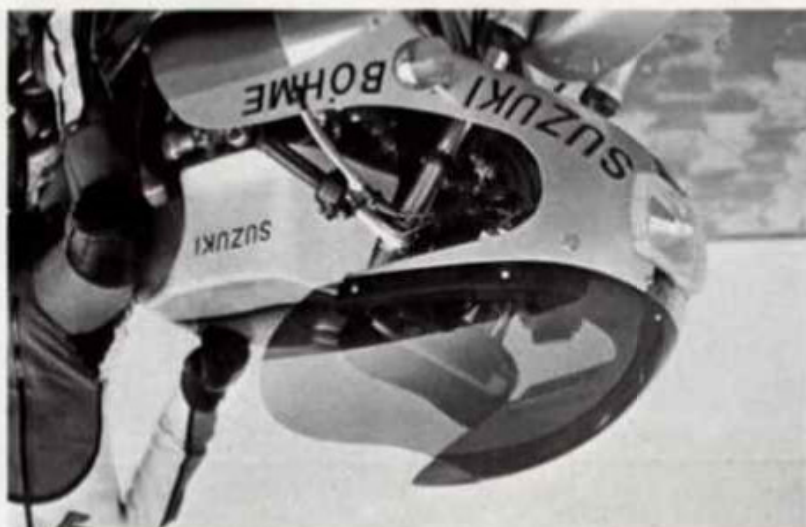
GS 750 Best.-Nr. 9/1