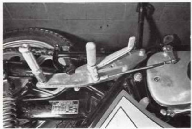
GS 750 links Best.-Nr. 11/1