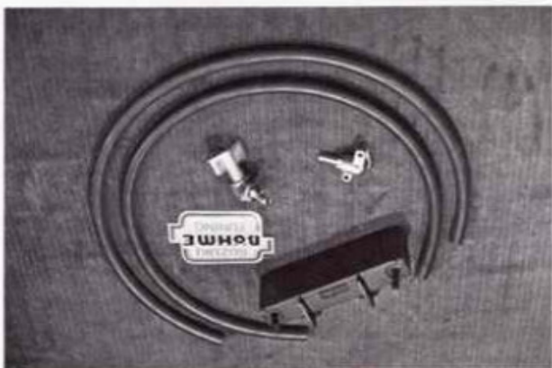
Ölkühler für SUZUKI GS 750 und Kawasaki Best.-Nr. 20/d