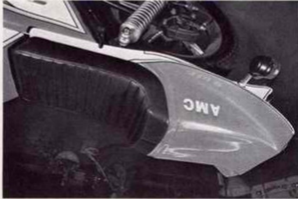
Höcker-Sitzbank Best.-Nr. 7/1