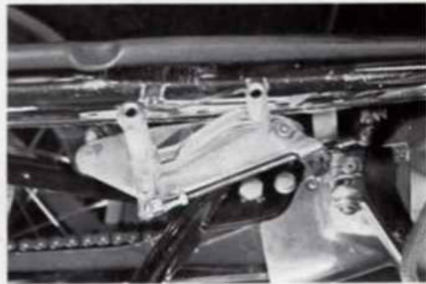
GT 250 FuBrasteranlage links 14/4

Best.-Nr. 40/a (Kegelrollenlager) 40/b (Bronzelager)