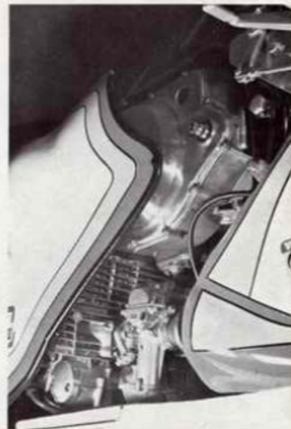
Mikuni-Vergaser \phi 30 Best.-Nr. 21/c

Umbausatz 940 ccm für GS 750 eingezogene Lautbüchsen \phi 72 geschmiedete Mahle-Kolben ca. 75 PS