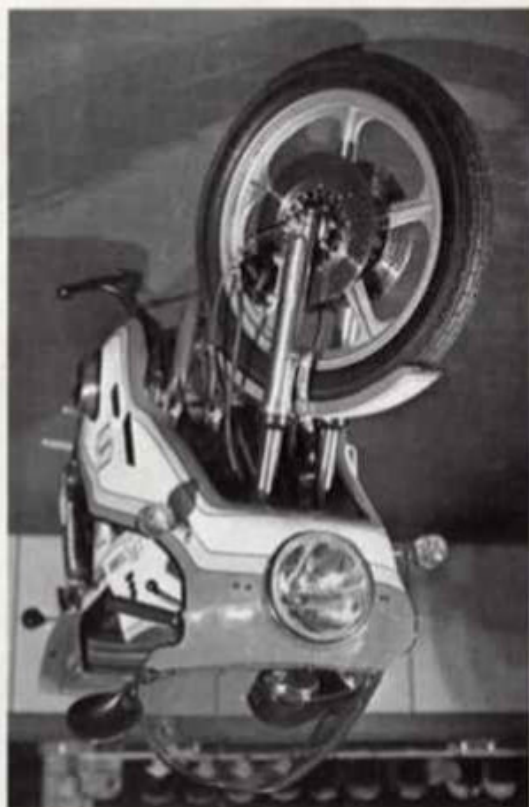
GS 750 Best.-Nr. 9/1