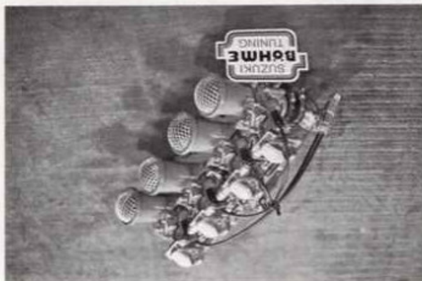
Dellorto-Einspritzvergaser für GS 750 / GS 1000 Best.-Nr. 20/c

VDO-Oltemperatur- anzeiger mit Geber für alle GS-Modelle Best.-Nr. 22/c