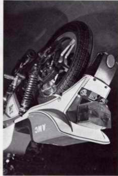
Höcker GS 750 Best.-Nr. 7/1