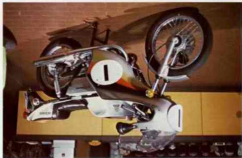
SUZUKI GT 250 Sport