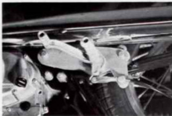
GT 250 FuBrasteranlage rechts 14/4