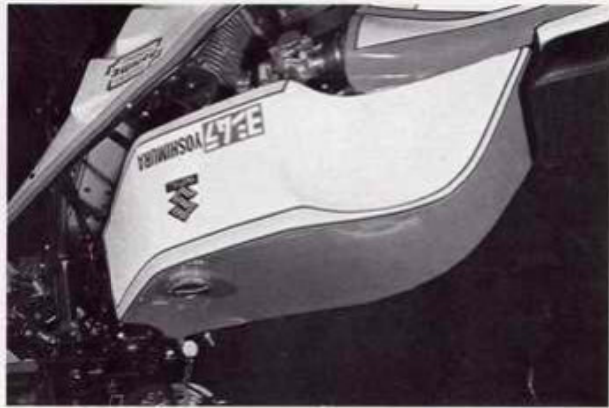
Tank GS 750/221 Best.-Nr. 4/1

für alle GS-Modelle lieferbar mit TÜV-Gutachten