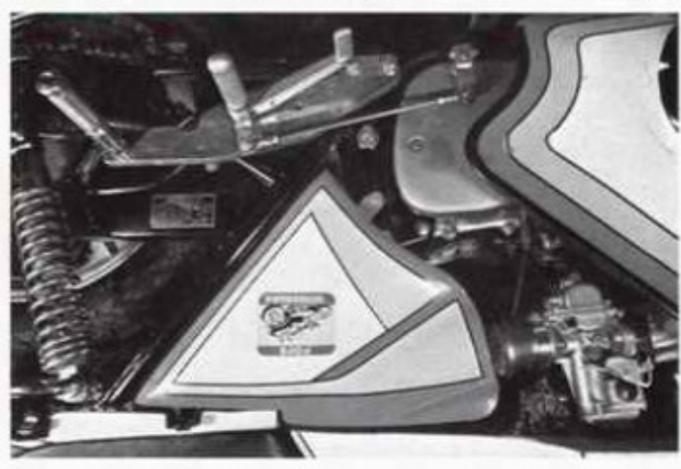
GS 750 links m. Seitendeckel Best.-Nr. 12/1 u. 10/1

Bestellnummern Seitendeckel rechts und links: Nur für offene Lufttrichter