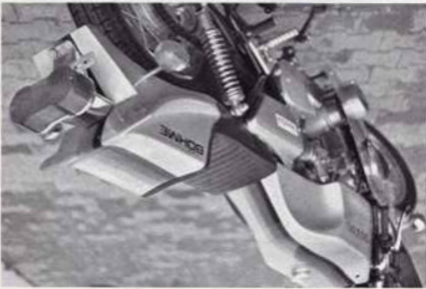
Tank GS 750 Best.-Nr. 4/1 Höcker Best.-Nr. 7/1