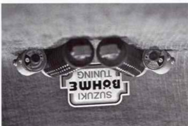
für SUZUKI 2- und 4-Takt Bestellnummer 26/1 3-Lt.-Kanister (Schraubverschluss)