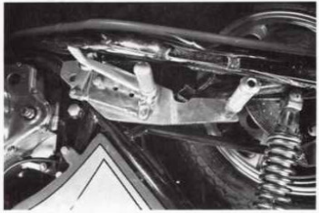
GS 750 rechts Best.-Nr. 12/1