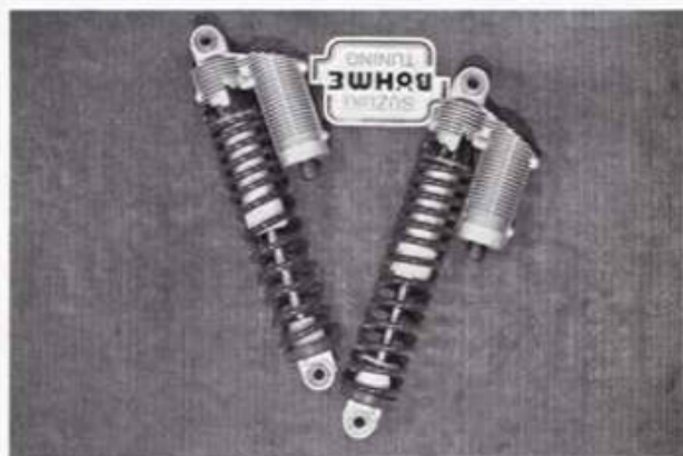
Marzocchi-Federbeine für SUZUKI lieferbar Best.-Nr. 20/a Auf Anfrage für andere Fabrikate lieferbar