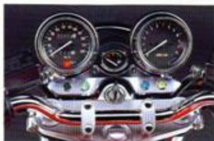
Die Instrumente der GSX 1200 zeichnen sich durch ihre klassische Übersichtlichkeit aus. Drehzahl und Geschwindigkeit auf einem Blick, dazu Tankanzeige und die wichtigsten Kontrollleuchten.