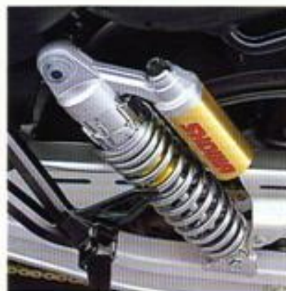
Komfort und Sicherheit in allen Lagen, am Hinterrad sorgen dafür die beiden Gas-Öldruck-Spindeldämpfer mit Ausgleichbehälter, die fünfstufige Federverspannung und die voll einstellbare Druckverföndung. Komfortabel zu reisen auf langen Fahrten und knallhart, wenn's drauf ankommt – die GSX 1200 ist für jede Tour perfekt gerüstet.

Power ohne Ende – und die GSX 1200 bringt sie sicher auf die Straße: dafür sorgt zum Beispiel der verwindungssteife Doppelschleifen-Rohrrahmen, die Teleskopgabel vorne mit ihren stattlichen 43er-Standrohren und die stabile Alu-Kastenschwinge. Die schwimmend gelagerte 310-mm Brembo Vierkolben-Doppelscheibe vorne ergänzt sich optimal mit der 240-mm-Scheibe hinten. Im Fall der Fälle packt die Bremsanlage kraftvoll, aber kontrolliert zu. Für perfektes Handling ist der Lenker optimal positioniert, der Bremshebel läßt sich 6fach verstellen und die niedrige Sitzhöhe sorgt für sicheren Stand.