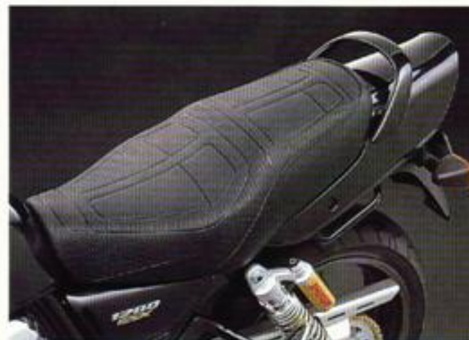
Ob alleine oder zu zweit: Mit der GSX 1200 läßt es sich ganz easy reisen. Die hochwertige Sitzbank bietet mit ihrem rutschfesten, strapazierfähigen Kunstlederbezug auch zu zweit angenehmen Sitzkomfort. Dazu eine Fußrasten-Positionierung, die den Sozius auch längere Fahrten angenehm hinunter sich bringen läßt. Als praktisches Plus ist ein elegant, in der Motorabfarbe lackiertes Halbgriff ortsunverföndlich mit dabei. Ebenfalls sinnvoll und immer mit dabei: der Hauptständer für sicheren Stand.