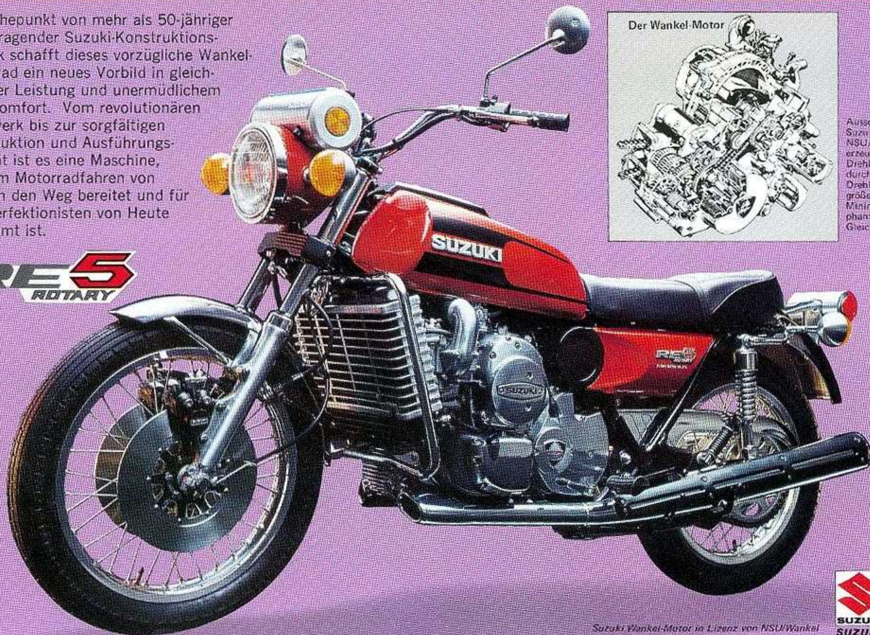
Der Wankel Motor